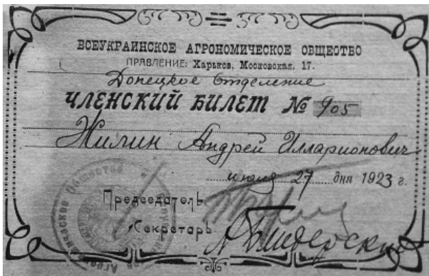
Рис. 1. Членський квиток ВАТ

Отже, загальна кількість членів відділень ВАТ станом на 1924 р. становила вже понад 1000. Поряд з тенденцією збільшення бажаючих вступити до лав членів Товариства зростала кількість новостворюваних філій [12].