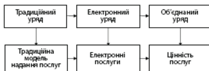
Рис.1. Еволюційний підхід до надання державних послуг [4].

Надання послуг у державному секторі з часом розвинулося від традиційної моделі врядування, що розподіляє послуги традиційними шляхами, до електронного управління й електронних послуг і, врешті-решт, інтегрованого підходу наголосом на цінності послуг для кожного окремого громадянина (див. Рис.1.):