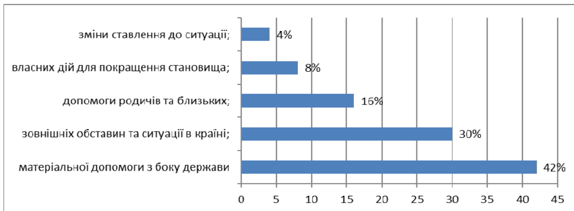
Рис.1. Результат опитування (від кого/чого залежить якість життя)

За результатами ранжування встановлено, що благополуччя членів сім'ї більшою мірою залежить від допомоги держави й зовнішніх обставин, ніж від власних дій та зміни ставлення до ситуації. Це свідчить про те, що батьки багатодітних родин схильні перекладати відповідальність за власне життя на інших (див. рис. 1)