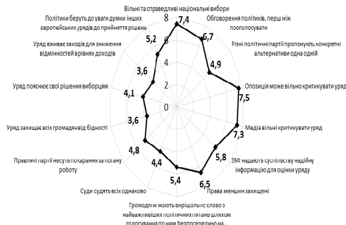
Рис. 5. III профіль функціонування основних демократичних цінностей (середні значення серед країн, яких віднесено до даного профілю)

Для країн, які віднесено до третього профілю демократизації, характерно, окрім забезпечення вільних та незалежних виборів, обговорення політиків та політичних процесів, ще й забезпечення громадянської включеності у вирішення найважливіших питань шляхом референдумів та добросовісне функціонування ЗМІ, які надають достовірну інформацію про діяльність уряду (рис. 5).