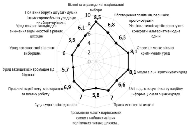
Рис. 3. І профіль функціонування основних демократичних цінностей (середні значення серед країн, які віднесено до даного профілю)

У результаті аналізу було виокремлено країни, які найбільш повно забезпечують такі елементи, як проведення незалежних виборів, захист уразливих груп (захист прав меншин), чесна та незалежна судова система, відповідальність уряду – за свою діяльність у разі негативних наслідків та пояснення своєї політики громадянам (рис. 3).