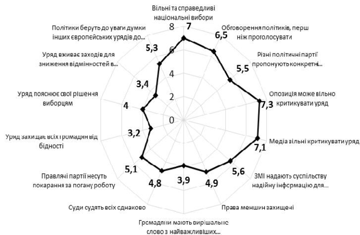
Рис. 4. II профіль функціонування основних демократичних цінностей (середні значення серед країн, які віднесено до даного профілю)

Критеріями віднесення до цього профілю стали: 1) достатньо високі показники щодо дотримання вільних виборів, можливості критики з боку опозиції та медіа (середні значення 7,1–7,3); 2) низький рівень захисту прав меншин (середні значення у діапазоні 3,2–4); 3) низька оцінка діяльності уряду (середні значення вище 6,9), діяльність медіа (середні значення вище 7–7,1), наявність політичних альтернатив (середні значення в діапазоні 5,3–5,6), незалежна судова система (середні значення 5–5,1).