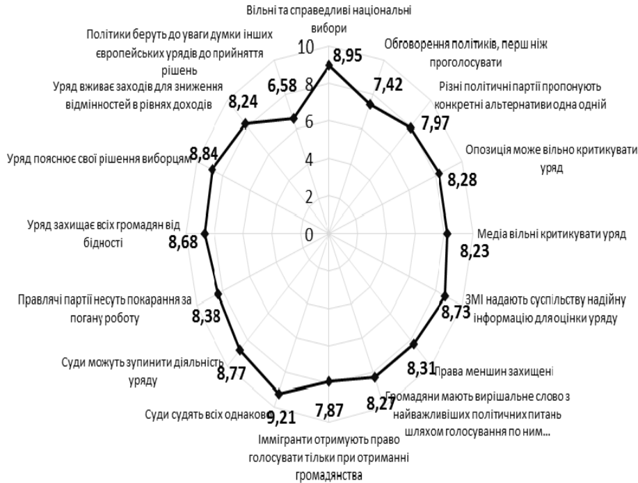
Рис. 1. Основні демократичні принципи