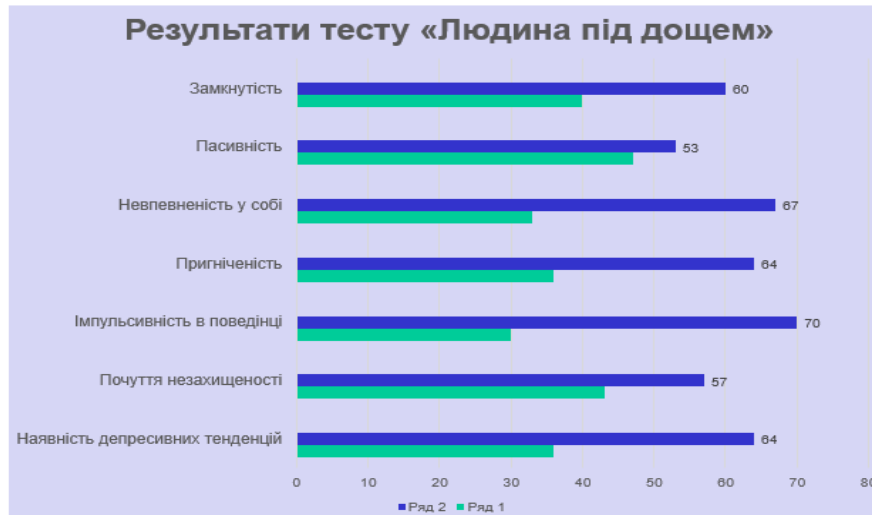
Рис. 3. Результати дослідження за рисунковим тестом "Людина під дощем"

Отже, визначено шість дошкільнят, що мають високий рівень тривожності (60 %) і четверо, яким характерний середній рівень тривожності (40 %). Низький рівень – відсутній.