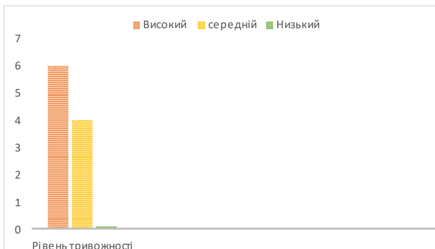
Рис. 2. Результати дослідження рівня тривожності дошкільнят із неблагополучних сімей

(рис. 1). Іноді деякі діти просять дозволу позначити позиції двох чоловічків. Вважаємо, що в цьому випадку не слід обмежувати їхній вибір, але необхідно зафіксувати, який чоловічок був відзначений у першу чергу, який у другу, оскільки співвідношення цих виборів може бути досить інформативним. Наступним кроком було використання тесту тривожності (Р. Теммл, М. Доркі, В. Амен) (рис. 2) [1, с. 20] Цей тест призначений для визначення рівня тривожності дитини дошкільного й молодшого шкільного віку. Експериментальний матеріал – 14 малюнків, кожен із яких відображає певну типову для життя дитини ситуацію. Кожен малюнок виконано у двох варіантах: для дівчинки та для хлопчика. Обличчя дитини – це лише контур голови. Кожен малюнок доповнений двома зображеннями дитячої голови, що за розмірами точно відповідає контурам обличчя на малюнку. На одному із двох зображень – усмінене обличчя, на іншому – сумне.