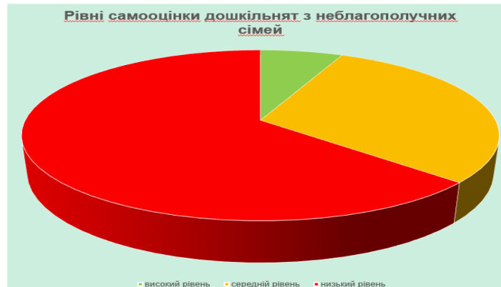
Рис. 1. Результати визначення рівня самооцінки дошкільнят за методикою В. Г. Щур

особистість проявляє себе особливо виразно. Завдання не мають однозначних "правильних" рішень і приваблюють своєю простотою: потрібно мати лише папір та олівець, їх легко провести з дитиною, яка навіть не вміє ще читати. Дошкільник не розуміє, що його "досліджують" ... Діти не знають інтерпретації своїх малюнків, передаючи на папері свої переживання. Педагоги отримують достовірні результати. Це перевірено на безлічі випробовуваних. З іншого боку, складно, знаючи значення всіх деталей, без підрахунку відповідей "так" чи "ні", напевно визначити мікроклімат кожної родини. Проте, як вважають психологи, довіряти інструкціям можна.