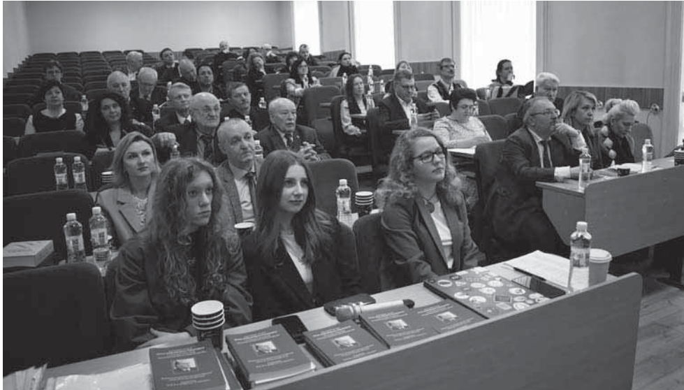
Учасники пленарного засідання конференції (юридичний факультет Львівського національного університету імені Івана Франка, 28 березня 2025 р.)

роботі “Теорія істини в радянському праві” (1959). С. Рабінович наголосив на низці наскрізних методологічних засад наукової творчості проф. П. Рабіновича і тих ідей, які видатний теорійник сповідував протягом свого творчого життя: принципах об’єктивізму і соціально-сутнісної спрямованості правового пізнання.