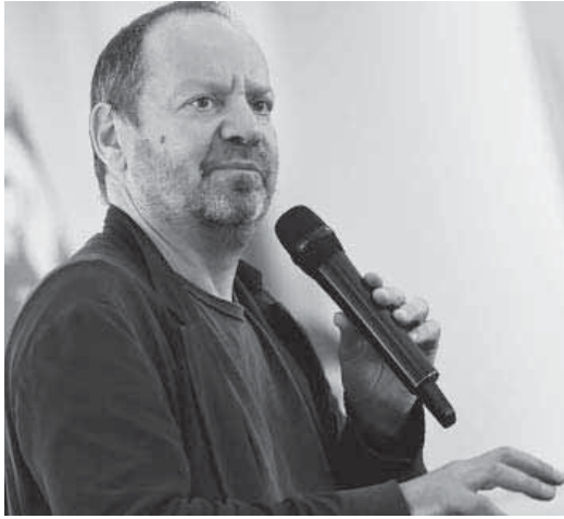
Виступ учасника конференції Філіпа Сендса – професора права, директора Центру міжнародних судів і трибуналів Університетського коледжу Лондона, 29 березня 2025 р. (онлайн)