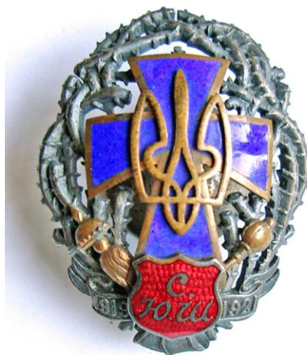
Рис. 3. Нагрудний знак випускника Спільної юнацької школи (1-го типу), друга половина 1930-х рр.