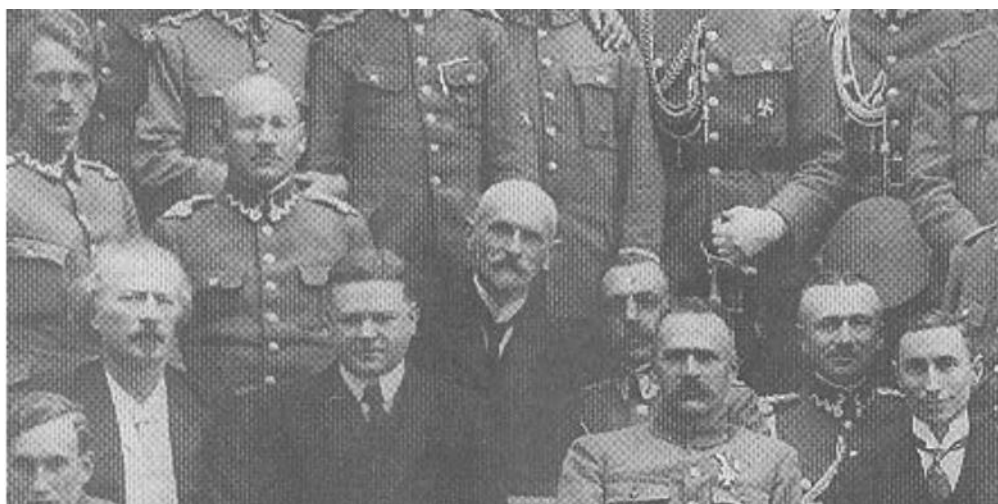
Рис. 2. Герберт Гувер та Юзеф Пілсудський в оточенні офіцерів Війська польського

У рамках свого візиту до Польщі Г. Гувер зустрічався з керівництвом держави, зокрема Юзефом Пілсудським. Збереглися світлини у польській пресі що висвітлювали цю подію (рис.2).