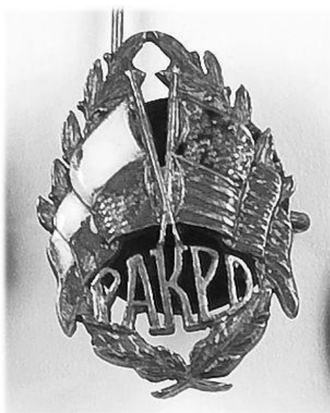
Рис. 3. Знак робітника Польсько-американського комітету допомоги дітям 1920 рік

Варто додати, що робітники Польсько-американського комітету допомоги дітям носили відповідні знаки (див. рис. 3).