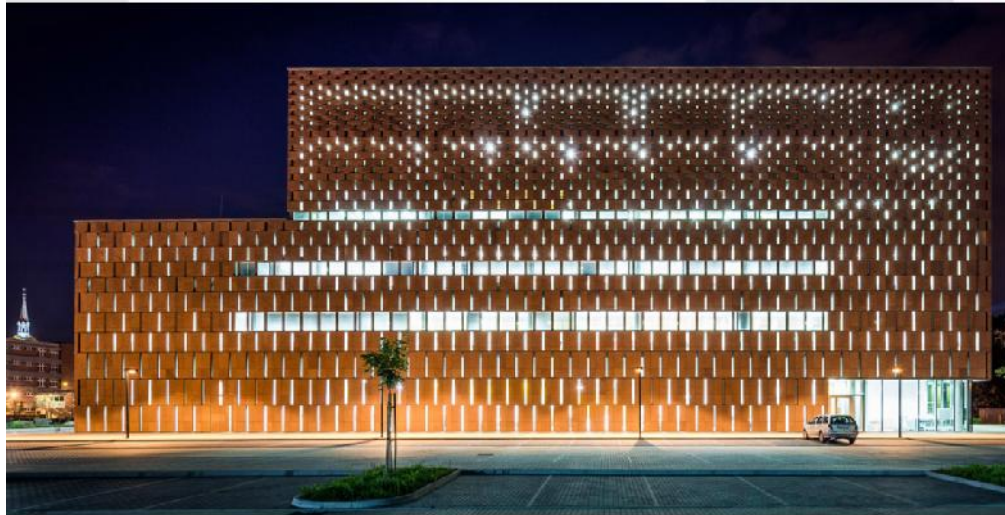
Biblioteka Akademicka w Katowicach