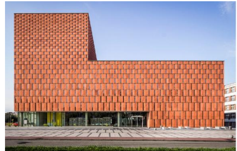
Biblioteka Akademicka w Katowicach, fot. Jakub Certowicz / CINIBA

"To symboliczny obraz dziejów: pruskiego Kattowitz, stolicy województwa w II RP, Stalinogrodu, ośrodka socmodernistycznego progresu czasów PRL-u z najnowszą tendencją dążeń miasta ku idei metropolii wiedzy, nauki i kultury " – pisał o katowickiej bibliotece na łamach miesięcznika "Architektura-Murator" Ryszard Nakonieczny, znawca i badacz śląskiej architektury.